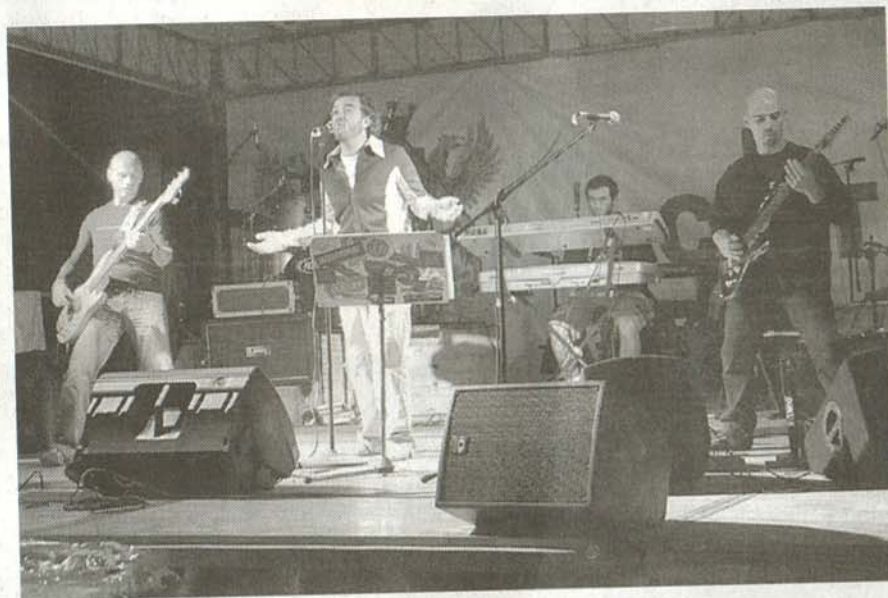
Momenti della festa alla baracca di via Casalcemelli